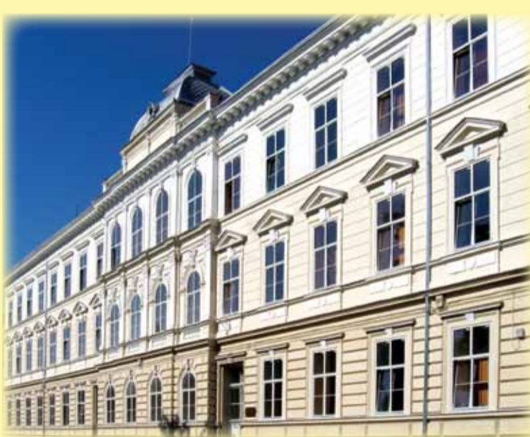
ȘCOALA ORĂȘENEASCĂ DIN CETATE

Prețul clădirii a fost de 210.000 coroane. Ea s-a ridicat pe locul unei case vechi din 1807, unde se desfășura activitatea Școlii Orășenești din cartierul Cetate. Cum clădirea era monumentală, igienică și încăpătoare, în ea s-au desfășurat, concomitent, cursurile mai multor școli. Să