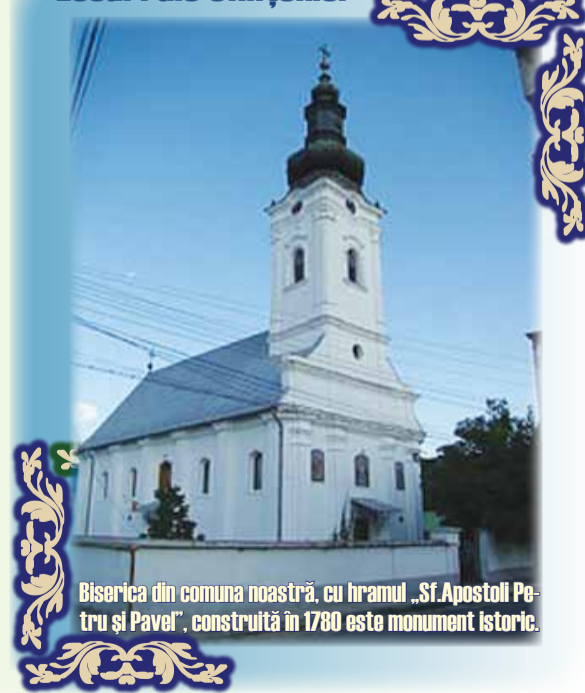
Biserica din comuna noastră, cu hramul „Sf. Apostoli Petru și Pavel”, construită în 1780 este monument istoric.