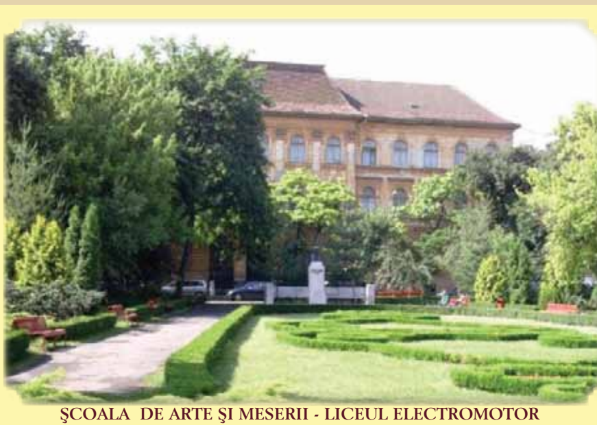
ȘCOALA DE ARTE ȘI MESERII - LICEUL ELECTROMOTOR