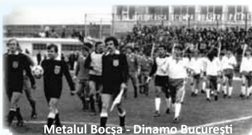
Metalul Bocșa - Dinamo București