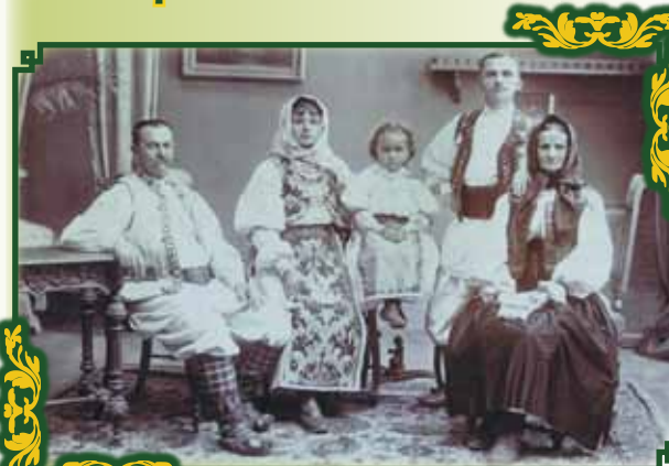
Banatul în trei generații