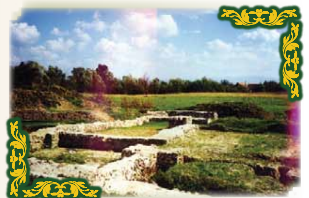
Temelii ale așezării noastre

La 5 iulie 1994 localitatea Făget a fost declarată oraș, având în subordine 10 sate.