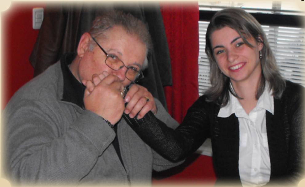
Maestrul, la masa interviului alături de directoarea jurnalului nostru

Iubiți iubirea și o cântați, ce înseamnă iubirea?