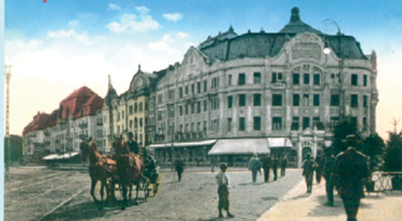
Timișoara în anul 1914

Actuala Piața Victoriei, cunoscută și sub numele Piața Operei, a avut mai multe denumiri - Bulevardul 30 Decembrie, Bulevardul Regele Ferdinand, Ferencz Jozsef Ut., Franz Josef Strasse și Lloyd Sor. În prim-plan, Palatul Lloyd, proiectat de arhitectul Lipo Baumhorn și construit între 1910-1912. În acest palat au funcționat Bursa de Mărfuri și Bursa Agricolă, Uniunea Comercianților, Societatea și Clubul Lloyd, iar la parter, Cafeneaua și Restaurantul Lloyd. Astăzi, aici funcționează Rectoratul Universității Politehnica din Timișoara. Următorul edificiu este Palatul Merbl, construit în 1911 de arhitectul cu același nume, apoi Palatul Dauerbach, 1911-1912, construit de arhitectul Lazslo Szekely.