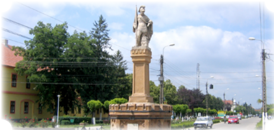
Statuia Sfântului Florian, protectorul pompierilor și simbol al orașului

În ultimii ani, după Revoluția din Decembrie 1989, orașul a parcurs ample transformări de ordin economic, politic și social. Prezentul orașului este marcat de perspective pozitive în privința investițiilor străine, dotărilor edilitare și a dezvoltării orașului în general.