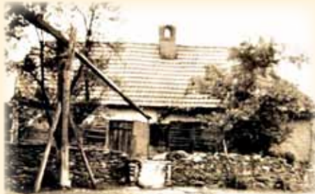
Casa natală din Surducu Mic

La împlinirea unui secol și jumătate de la nașterea celei mai cunoscute personalități bănățene, nu este lipsită de interes abordarea unor erori din biografia inventatorului, preluate în mod necritic și popularizate. Nu mică a fost nedumerirea semnatarului acestor rânduri, când, în această vară, citea pe un panou din expoziția Muzeului „Vasile Pârvan”, privind „Istoria aviației românești în cartofilie, filatelie, fotografie”: „Traian Vuia s-a născut la 17/30 august 1872, într-o familie de țărani din satul Surducu Mic. Sunt surprinzătoare aceste erori, pentru că după 1990 s-au publicat zeci de cărți, studii și articole despre viața și activitatea lui Traian Vuia, s-au organizat numeroase expoziții, conferințe și simpozioane. Și, totuși, la începutul perioadei comuniste, Vuia era prezentat drept fiu de țărani bănățeni, care, din cauza nepăsării autorităților, a fost obligat să plece din țară pentru a face cercetări în domeniul aviației.