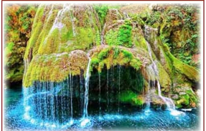
Cascada Bigăr, una dintre cele mai frumoase căderi de apă din lume, oferă celor care o vizitează o priveliște de basm