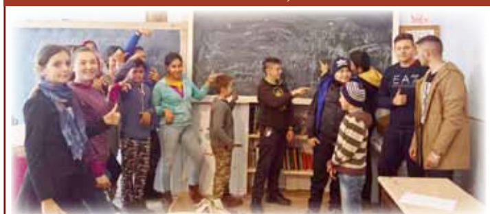
Elevii școlii vermeșene, la o lecție despre o „lume mai bună”.