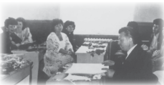
Peste ani, la ora de dirigenție

T reptele vieții! Da, viața are multe trepte! Superbă metaforă, cu o profundă valoare sugestivă. Viața este, de fapt, o scară, un urcuș anevoios. Dar „dacă ai luat-o pe un drum anume, perseverează cu orice preț; n-ai decât de câștigat, nu riști nimic!...Urcă, deschide uși! Dacă nu găsești nimic în spatele acestora, nimic nu este pierdut. Avântă-te înainte, spre alte scări”,