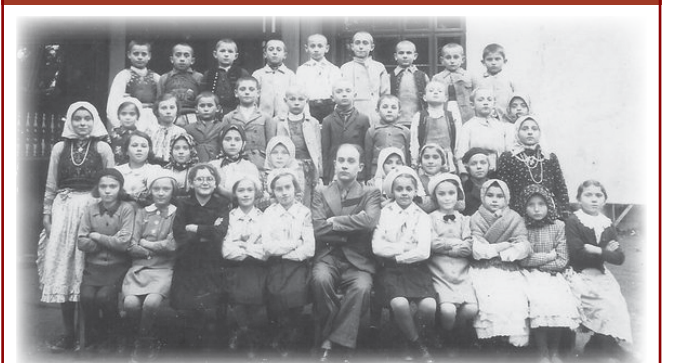
Elevii de odinioară ai comunei Bârzava alături de dascălul lor.