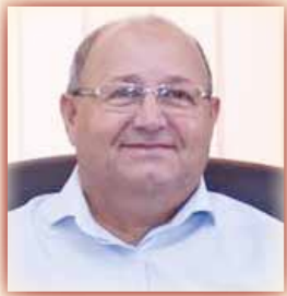
Ioan MUNTEANU - Primar al comunei Liebling