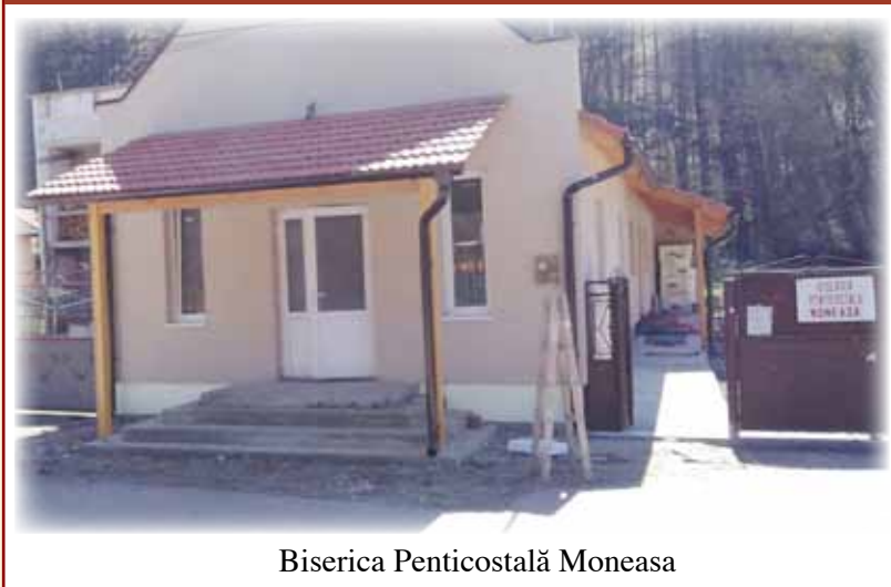
Biserica Penticostală Moneasa