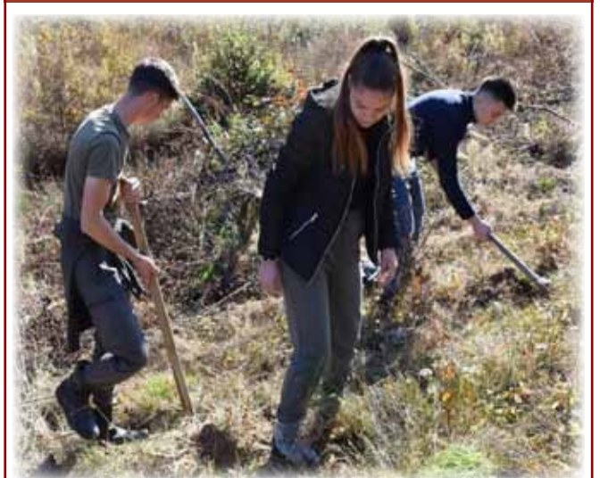
Inimoșii tineri ai Bârzavei în plină acțiune de reîmpădurire a comunei lor.