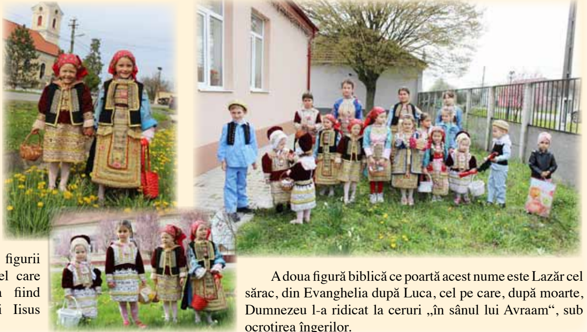
A doua figură biblică ce poartă acest nume este Lazăr cel sărac, din Evanghelia după Luca, cel pe care, după moarte, Dumnezeu l-a ridicat la ceruri „în sânul lui Avraam“, sub ocrotirea îngerilor.

Amintim cititorilor că numele Lazăr, pe care sărbătoarea îl poartă, vine din limba ebraică, însemnând „Dumnezeu ajută” și este asociat figurii biblice a lui Lazăr din Betania, cel care a fost înviat din morți, aceasta fiind considerată una din minunile lui Iisus descrise în Evanghelia după Ioan.