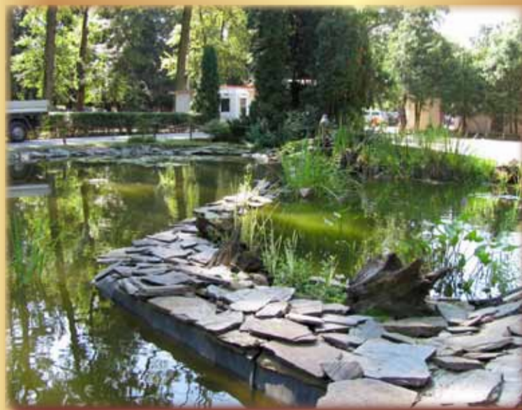
Timișoara - Pădurea Verde

Astăzi situația este în continuă degradare. Eforturile au fost puține și incoerente. Dacă