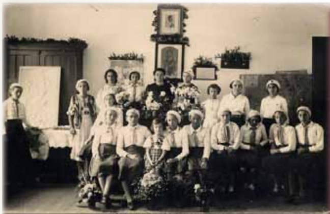
ȘCOALA DIN FĂGET - 1938

1) Conform C.F. 51 F.G. nr. top. 66 fondului școlar romano-catolic îi aparține imobilul 74 (școală) existent la 1857 și un teren intravilan în suprafață de 2877 m 2 .