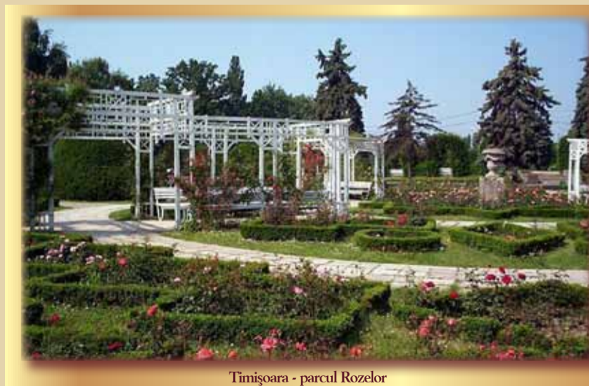
Timișoara - parcul Rozelor

Vine toamna și, odată cu ea, parcurile timișorene se îmbracă în culori uluitoare. Dintre frumoasele noastre parcuri (cinste cui le îngrijește cu atâta grijă!), unul - cel al rozelor - merită o privire mai atentă. În anul 1891, Timișoara găzduiește o mare expoziție industrială, agrară, comercială, intitulată Expoziția Universală (nu a mapamondului, ci a zonei). Cu acest prilej trebuia găsit un spațiu pentru toate exponatele. Cum terenul dintre parcul din Fabric (Coronini, pe atunci) și Parcul Central (Scudier, în epocă) era liber, Primăria dispune și populația participă cu entuziasm la ridicarea unui parc de 90.000 de metri pătrați. Frumusețea deosebită a aranjamentelor florale (autori celebri în Europa: Mühle, Niemetz, Agatsy) atrage admirația tuturor, inclusiv împăratului Franz Josef, care-l vizitează. După numele său este numit și parcul, creat ca un adevărat parc englezesc.