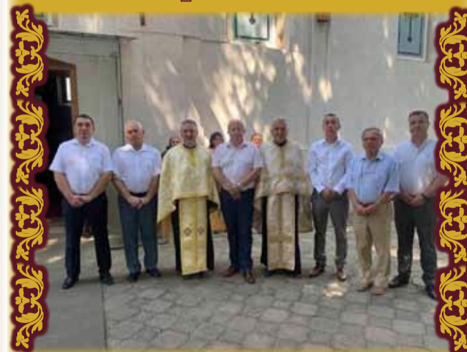
La hramul bisericii „Adormirea Maicii Domnului” – august 2021