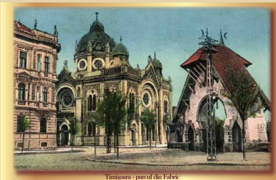
Timișoara - parcul din Fabric

Este cu siguranță primul parc, în înțelesul actual al cuvântului, creat pe teritoriul municipiului Timișoara, pe la mijlocul veacului trecut, pe terenul liber existent între fortificație și Fabric. La câțiva ani distanță, generalul Coronini - pe atunci guvernator al acelei formațiuni politice hibride: Voivodina sârbească și Banatul Timișan - inițiază activitatea de transformare a locului într-un parc. Parc ce-i va purta numele până prin 1918. Oficial, Parcul Coronini este deschis în anul 1868: La doar câțiva ani, parcul este preluat în gestiunea Primăriei, care vinde spații libere pentru construcția de clădiri. Așa se nasc casele dintre Cinema Apollo și Piața Traian de azi. Suprafața rămasă, de 40.672 metri pătrați, este îngrădită și constituie parcul propriu-zis. Gardul este cel inițial, cu partea inferioară din cărămidă și cea superioară din fier forjat. Mai acum câteva decenii s-a pus problema înlocuirii lui;