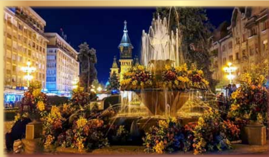
Timișoara în anii în care mai era „orașul florilor”