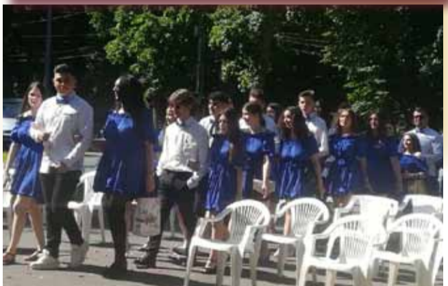
Poză de la defilarea claselor a XII-a