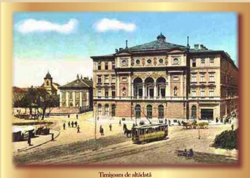
Timișoara de altădată

Cartierul își ridică biserici: două catolice, una reformată și una ortodoxă română, mai târziu. Are școală primară, mai multe în timp, cluburi sportive, mai multe fabrici: una dintre platformele industriale de mai târziu aici se ridică. Din anul 1948 devine cartier al orașului. O linie de tramvai (azi linii-