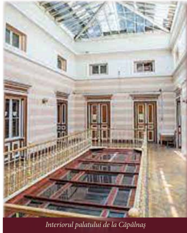
Interiorul palatului de la Căpâlnaș

De pe Valea Cerneiului, cu umbrele serii în coarne, se întorc vitele de la păscut. În fiecare dimineață și seară, același interminabil du-te-vino, învăluit în