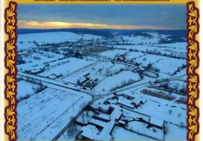
Comuna Bata la vreme de iarnă, dar să o vedeți primăvara!