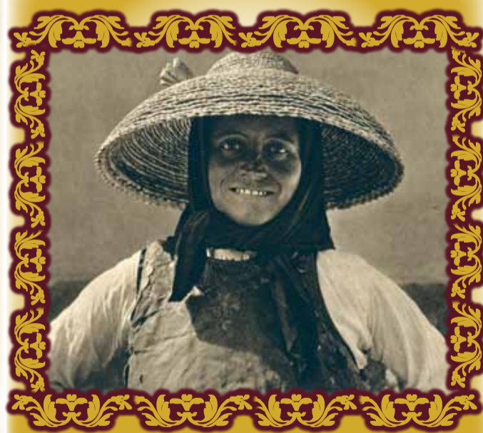
Fotografie din anul 1935, nemțoaică din Liebling, având pe cap o pălărie de paie cu margini întoarse în jos, pe care o poartă la lucrul câmpului. Pălăriile de acest tip le purtau atât femeile germane, cât și românele.