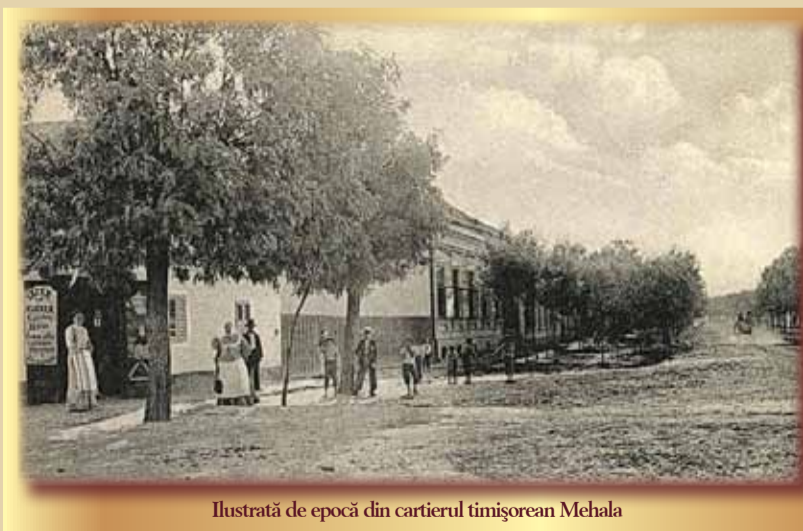
Ilustrată de epocă din cartierul timișorean Mehala

Ce observă turistul rătăcit prin Mehala? În primul